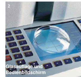
Glasauflage und Bedienbildschirm

WECOs konventioneller 3-in-1 Schleifautomat überzeugt aufgrund seiner Attraktivität und Funktionalität. Als 'Alles in einem' Gerät erfüllt er alle Bedürfnisse einer modernen Werkstatt: Abtasten von Brillenfassungen, Zentrieren aller Glastypeen und Schleifen von Gläsern. Alle notwendigen Funktionen sind auf kompaktem Raum vertreten. Die WECO Edge 310 ist mit einem klaren und leserlichen Bildschirm sowie einer ergonomischen Tastatur ausgestattet. Dies ermöglicht eine effiziente und mühelose Bedienung. Jeder Arbeitsschritt wird auf dem übersichtlich gestalteten Bildschirm durch klare Symbole angezeigt, um dem Benutzer die volle Kontrolle über alle Arbeitsschritte zu geben. Der WECO Edge 310 ermöglicht so eine effiziente und zügige Werkstattarbeit.