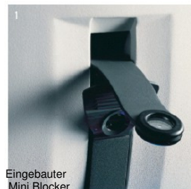
Eingebauter Mini Blocker